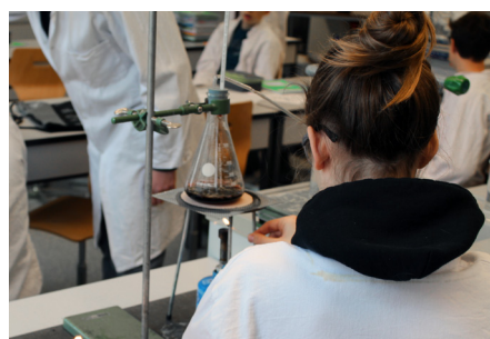
Eindrücke aus dem Zyklus 3