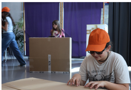
Theateraufführung Freifach Theater