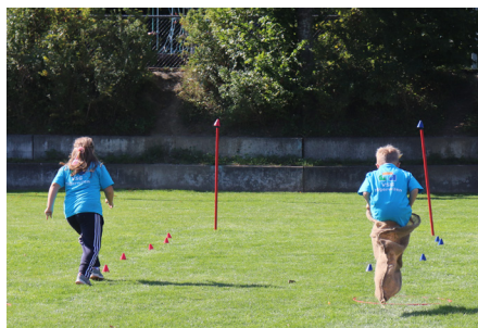
Sporttag des Zyklus 1

Die Schulverwaltung mit den Abteilungen Administration und Finanzen unterstützt die Behörde und Schulleitung.