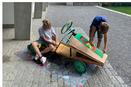
Projektwoche des Zyklus 2