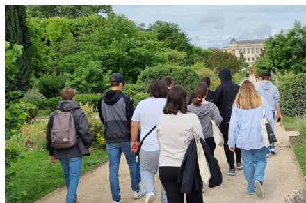
Kulturreise nach Paris der 9. Klasse